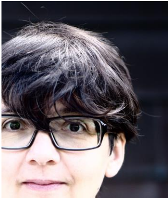
Gabriele Vollmar Wissen+Kommunikation

Kanzleistr. 35 D-72764 Reutlingen Tel.: +49 (0) 7121 / 12 60 377 E-Mail: info@wissen-kommunizieren.de Web: www.wissen-kommunizieren.de